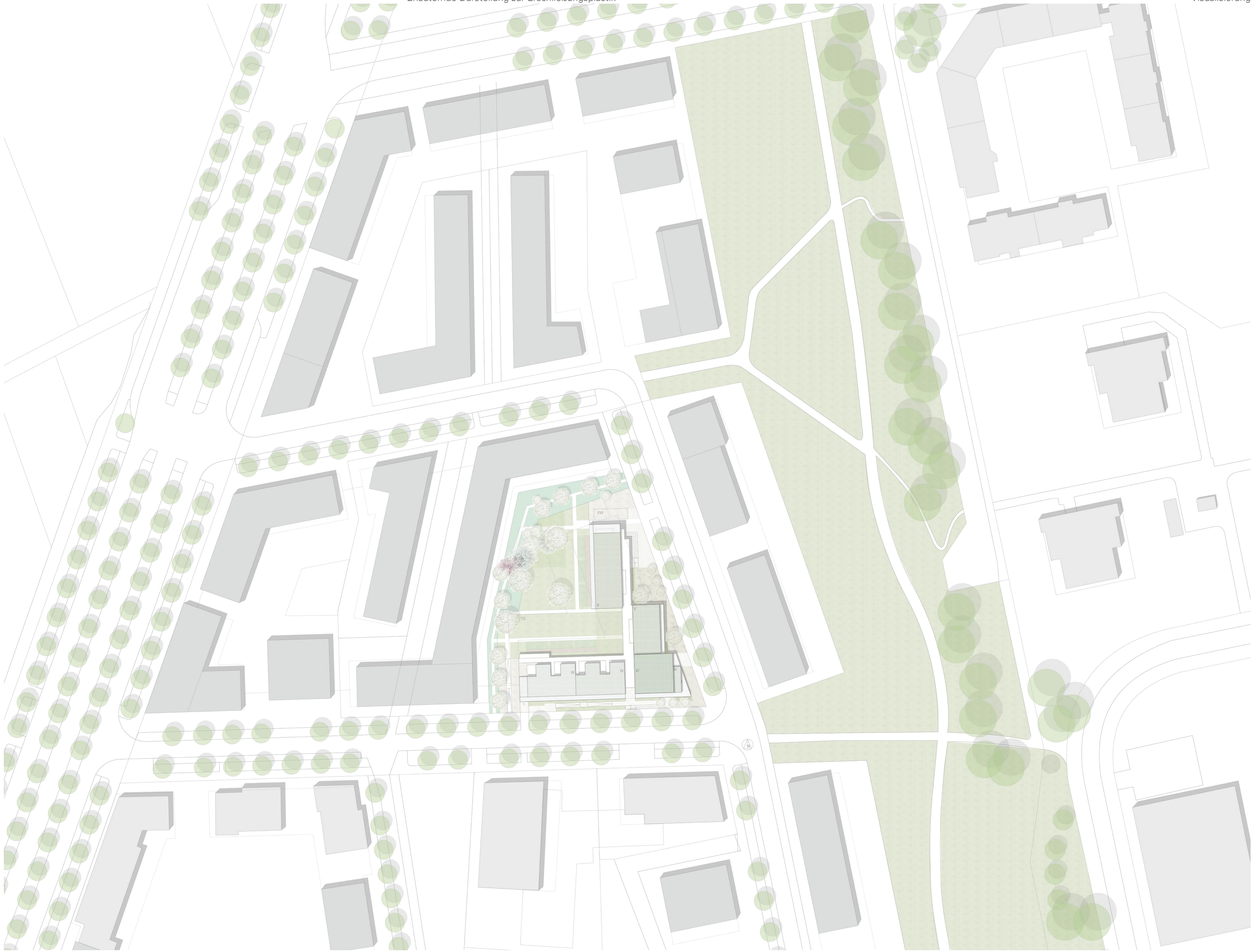
Lageplan M 1/500