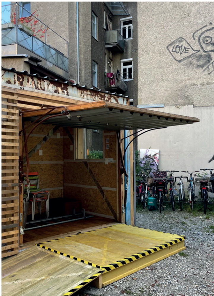
Zirkulärer Container „re-up“ auf dem Bauplatz in der Metzgerstraße 5a in München seit Oktober 2021

Container und Foto: Johannes Daiberl, www.zirkulaer.com