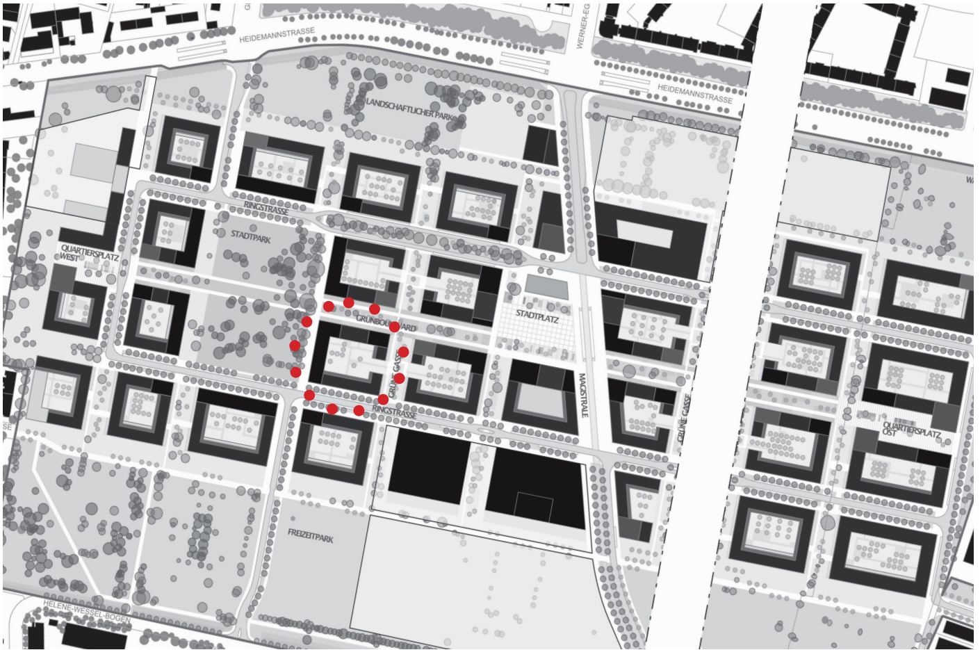
Auszug aus dem Masterplan - ARGE Max Dudler Hilmer Sattler