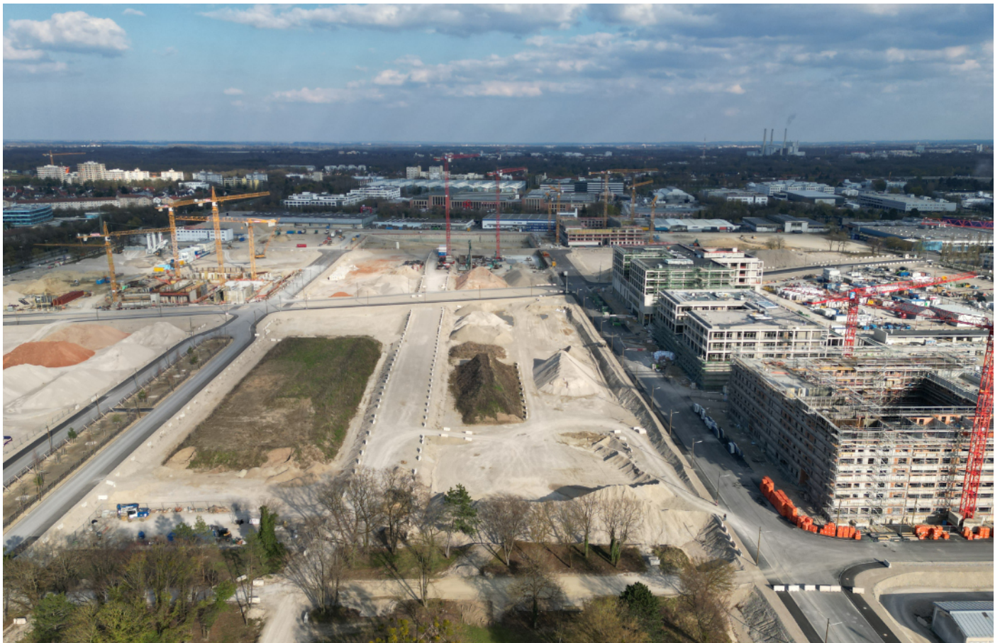
Luftbild Gelände Neufreimann