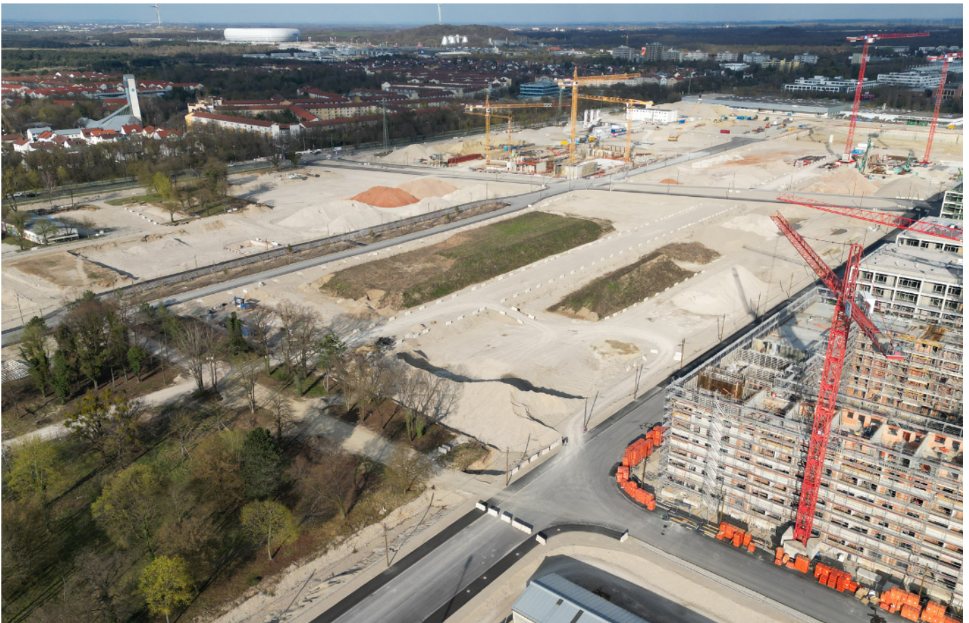
Luftbild Grundstück WA11 Neufreimann